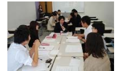
第1回 教職員研修(SD) ワークショップ